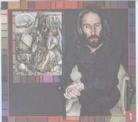
1 Nati sotto Saturno , 2008, tecnica mista, cm 110x130. Nudo melanconico , 2007, olio su lino, cm 60x80. Nudo che scende la scala , 2007, olio su lino, cm 160x110. La verità svelata dal tempo , 2007, olio su lino, cm 150x110. Nudo sulla scala , 2007, olio su lino, cm 100x60.